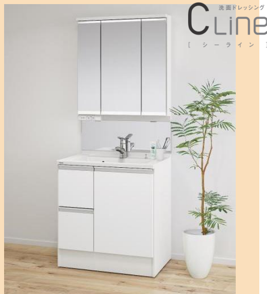
※イメージ写真のため、仕様等異なる箇所がございます (写真はスリムLED3面鏡・ミドルミラーありのタイプです)